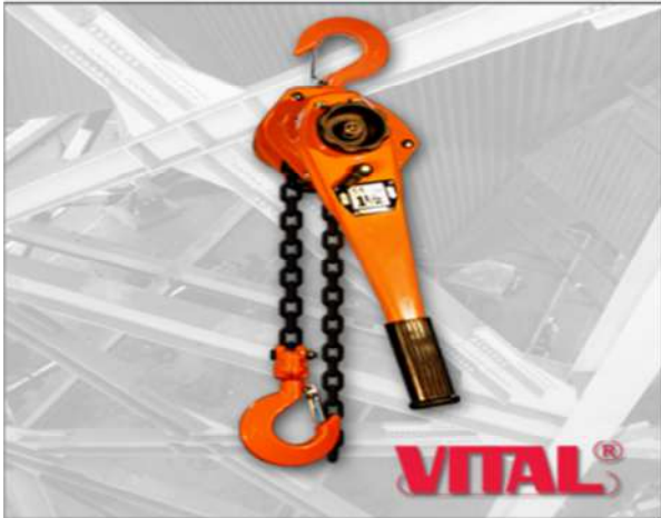
Palancas Serie VR2 Marca Vital